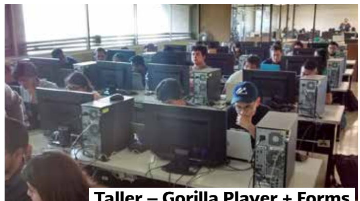
Taller – Gorilla Player + Forms