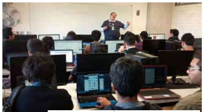
Taller – Microsoft Azure